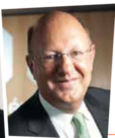
RÉMY PFLIMLIN