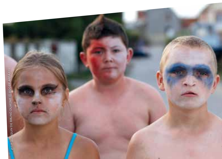
P'TIT QUINQUIN DE BRUNO DUMONT