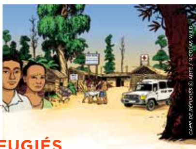
CAMP DE RÉFUGIÉS

La rédaction franco-allemande du ARTE JOURNAL porte un regard européen sur l'actualité. En 2014, ses deux éditions quotidiennes ont notamment suivi le conflit en Syrie, la situation en Ukraine et les JO de Sotchi ou encore décrypté les élections présidentielles en Algérie et en Tunisie. Temps fort de l'année, les élections européennes ont donné l'occasion à ARTE de scruter l'Europe sous toutes ses coutures. Depuis février 2014, ARTE JOURNAL JUNIOR porte l'actualité à hauteur d'enfant dans une édition hebdomadaire qui donne la parole aux plus jeunes. Le magazine YOUROPE s'est penché sur le processus de Bologne et sur la part grandissante des mouvements séparatistes en Europe. Les invités d'Elisabeth Quin et son équipe ont bousculé l'actualité dans le magazine 28' , des débats et des chroniques enjouées et un brin provocateur.