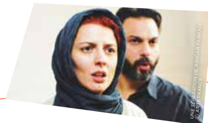
UNE SÉPARATION DE ASHRAF FARAG

POINT FORT SUR DES FEMMES ENGAGÉES À L'OCCASION DE LA JOURNÉE MONDIALE DE LA FEMME, ARTE CÉLÈBRE DES HÉROÏNES COMME LA MILITANTE RÉVOLUTIONNAIRE COMMUNISTE ROSA LUXEMBURG ET L'ACTIVISTE ALGÉRIENNE DJAMILA BOUPACHA DANS LE FILM POUR DJAMILA .