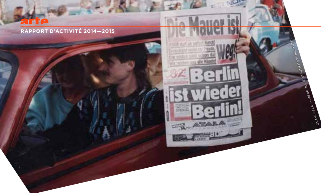
25 ANS DE LA CHUTE DU MUR