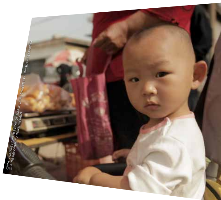
CHINE - NAÎTRE ET NE PAS ÊTRE DE MARJOLAIN GRAPPE ET CHRISTOPHE BARRETE

ARTE REPORTAGE prend la route des régions en crise et part à la rencontre de leurs habitants. Témoignages d'enfants sur les horreurs de la guerre civile dans Syrie : la vie obstinément , interrogation sur la signification du génocide au Rwanda : 20 ans après , et dans Chine : naître et ne pas être , coup de projecteur sur 13 millions de personnes nées en deuxième au pays de l'enfant unique et vivant cachées. Les équipes de tournage d'ARTE expérimentent aussi de nouvelles approches, comme lors du point fort Réfugiés ou du reportage Madagascar : la vallée maudite du saphir mêlant dessins et images filmées pour un résultat inédit.