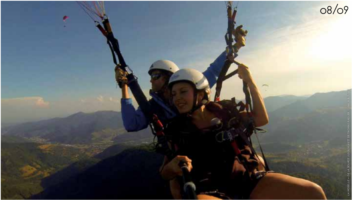
LA MOSELLE — DE LA SOURCE JUSQU'À LA MER DE THOMAS RADLER