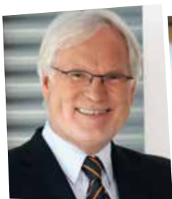
MARKUS SCHÄCHTER