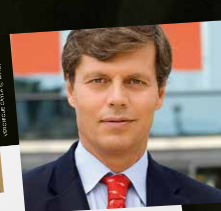
VERONIQUE CAYLA