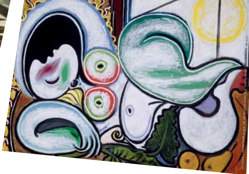
PICASSO L'INVENTAIRE D'UNE VIE DE HUGUETTE NANCY © PHOTO Remy / BENOÎT GRIFFI / G. F. 1501