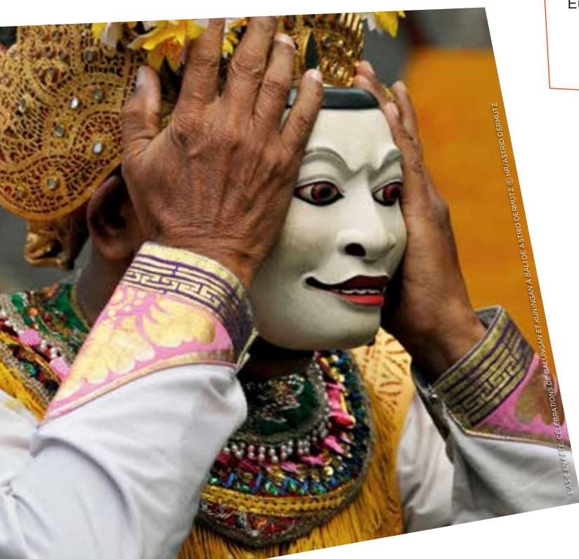
L'ASIE EN FÊTE : CÉLÉBRATIONS DE GALUNGAN ET KUNINGAN À BALI

Tous les mardis en deuxième partie de soirée, des documentaires historiques retracent les grands événements qui ont marqué l'Histoire récente. Avec des temps forts comme les 25 ans de la chute du Mur de Berlin, le massacre de la place Tiananmen ou encore Émirats, les mirages de la puissance consacré à ces micro-États du Golfe Persique. Sur les traces de civilisations lointaines et d'épopées héroïques, les samedis en prime-time ont fait revivre en 2014 les grandes batailles d' Alexandre le Grand ou encore le rôle clé des femmes de Vikings au XIe siècle.