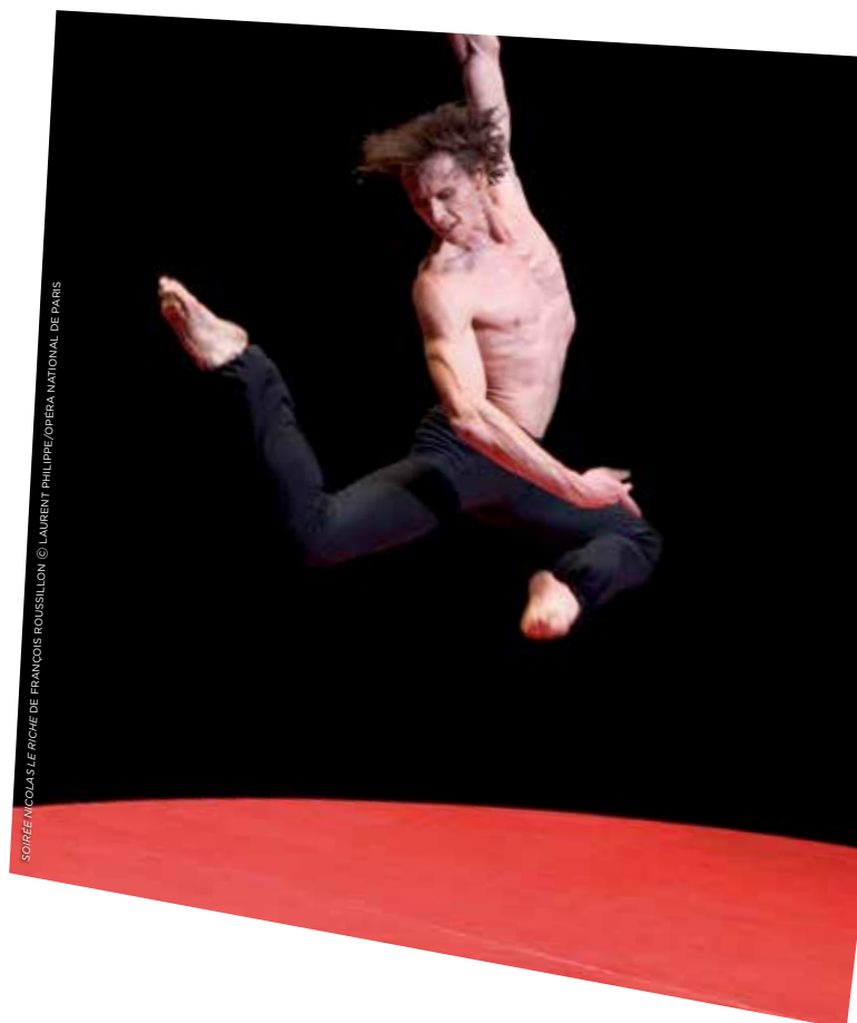
SOIRÉE NICOLAS LE RICHE DE FRANÇOIS ROUSSILLON

ARTE explore l'air du temps et les sous-cultures d'aujourd'hui pour mieux décrypter le monde de demain. À l'occasion d'une soirée spéciale Geek , CULTURE POP s'est consacré au mythe de Star Wars et à une culture de plus en plus mainstream. Retour également sur l'avènement des Super-héros : l'éternel combat . Pour les cinq ans de la mort de Michael Jackson, BAD 25 est revenu sur les origines de son plus gros succès. Conchita Wurst et Jean-Paul Gaultier se sont rencontrés AU CŒUR DE LA NUIT... ARTE a également proposé son traditionnel Fashion Weekend où ont défilé Balmain, Louboutin et Vreeland. Enfin, TRACKS a changé de look et s'est doté d'une application pour toujours plus de contre-cultures.