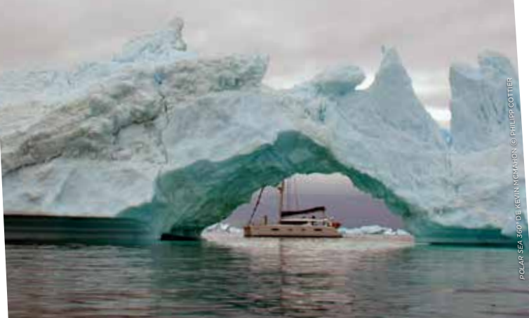
POLAR SEA 360° DE KEVIN TUCKERSON

Forum sur les questions environnementales, l'économie et les sciences, ARTE FUTUR invite des experts à discuter dès aujourd'hui avec les internautes du monde de demain. Des contenus exclusifs accompagnent la programmation à l'antenne. Plongée en réalité virtuelle dans l'Arctique, le volet web de Polar Sea a été récompensé en 2015 par le Grimme Online Award et l'application Polar Sea 360° a connu un franc succès. Sans oublier Netwars — La guerre sur le Net , également couronné par le Grimme Online Award, le jeu Et vous, seriez-vous un bon profiler ? , le webdoc La maudite histoire sur les origines du SIDA ou encore La tragédie électronique , traque GPS de nos déchets.