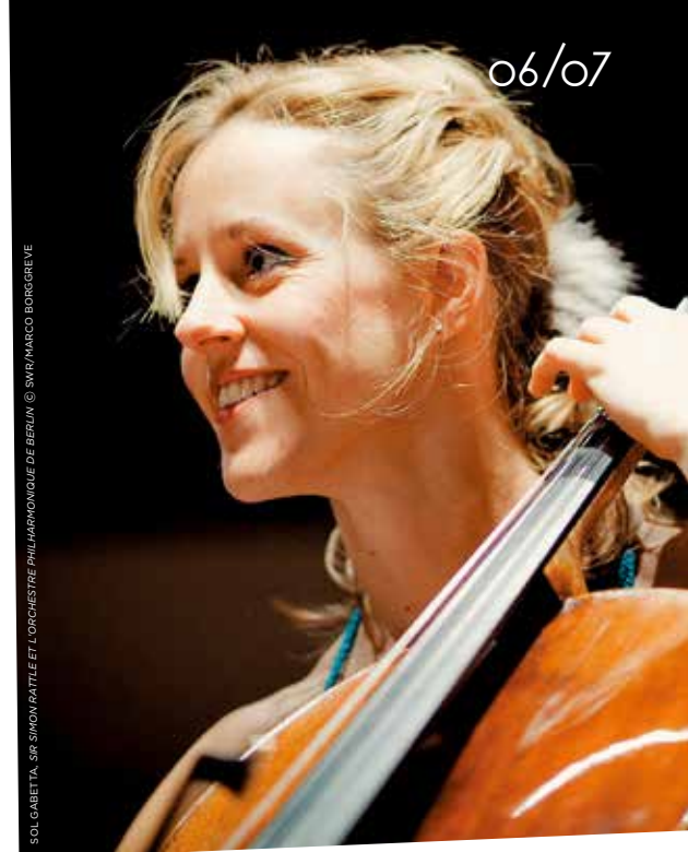
SOL GABETTA, SIBI SIMON RATTLE ET L'ORCHÈSTRE PHILHARMONIQUE DE BERLIN