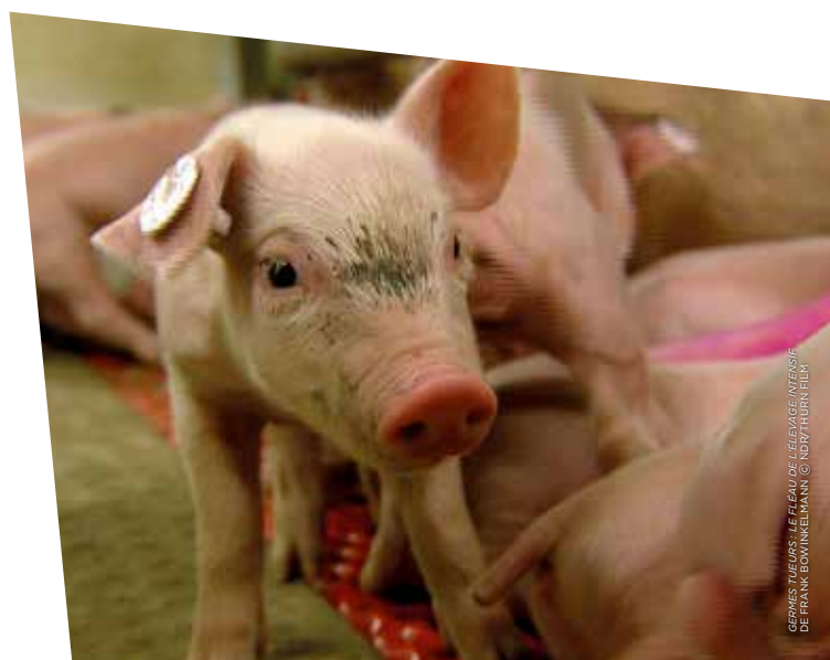
GERMES TUEURS : LE FLEAU DE L'ÉLEVAGE INTENSIF DE FRANK BOWINKELMANN

Parce qu'il est essentiel de bien connaître le passé pour comprendre le présent, ARTE a participé au travail de mémoire sur le centenaire du début de la Première Guerre mondiale avec un weekend spécial Comme en 1914 . Coproduction internationale d'envergure enrichie d'un web-documentaire et bouleversante saga documentaire, 1914 : Des armes et des mots a restitué en huit épisodes le cataclysme de la Grande Guerre à travers quatorze destins singuliers. Chronique réaliste et interactive, 1914, dernières nouvelles , récompensée par le FIPA d'or, a plongé l'internaute dans le quotidien et les préoccupations des habitants d'une Europe au bord de la déchirure.